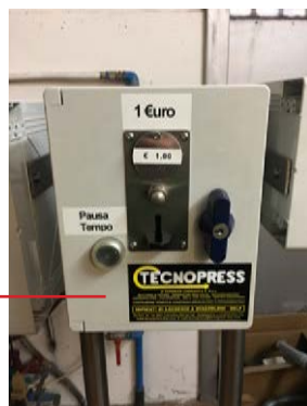
GETTONIERA CON PAUSA TEMPO (opzionale)