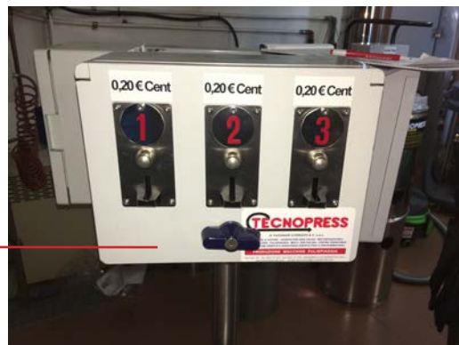
GETTONIERA 3 MODULI