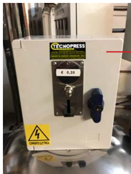
GETTONIERA 1 MODULO