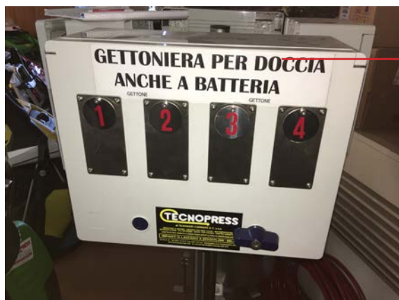
POSSIBILITA' DI FUNZIONAMENTO A BATTERIA (Opzionale)